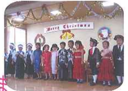
長崎聖マリア保育園のみなさま