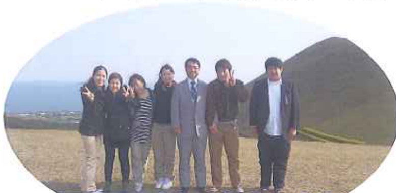
理事長と今年の新人です♪