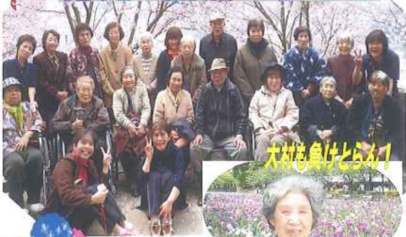
大村も鳥けとらん！

今年は早く梅雨明けし、例年以上の暑い夏となりました。『デイこえばる』ではそれ以上の熱気に大盛り上がり！！これまでの楽しい行事の数々を、ご紹介したいと思います。