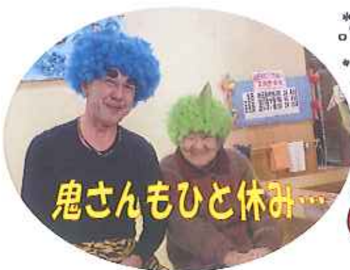
鬼さんもひと休み...

今年1年間、無病息災を祈願して 全ユニットで豆まき会を行いました。 どんな鬼を退治しましたか?