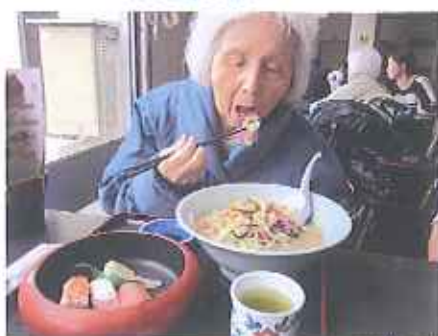
ちゃんぽん にぎり寿司