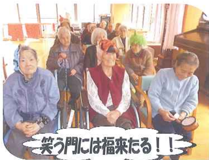
笑う門には福来たる!!