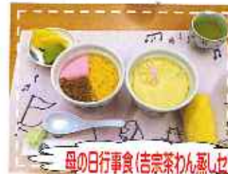
母の日行事食(吉宗茶わん 親子セット)