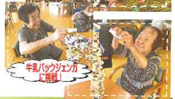
牛乳パックジェンカ に挑戦!