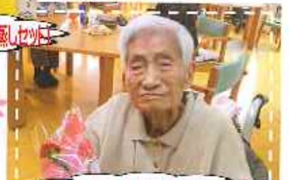
いつもありがとうございます