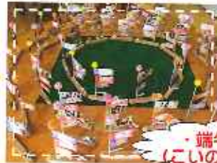
・端午の節句 (こいのぼり作成)