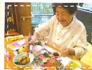
いっまでも元気でね