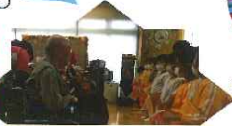
クリスマス会にて☆ 素敵なお礼の挨拶を ありがとうございました☆