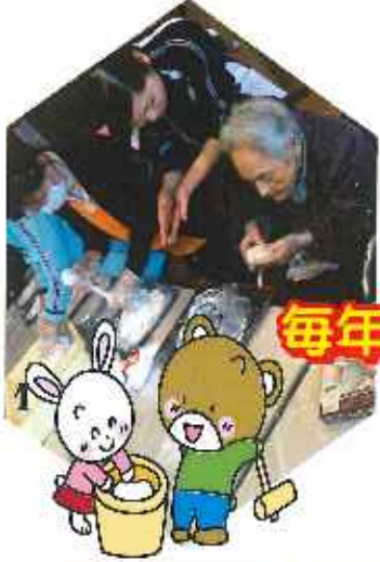
毎年恒例の餅つき！！