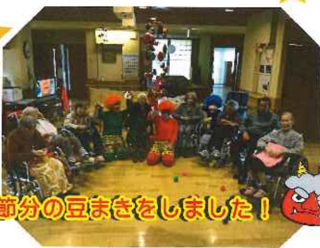
節分の豆まきをしました!