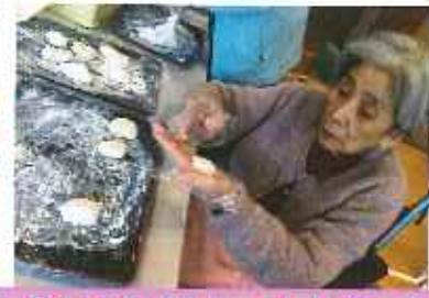
きれいに丸まったかな~☆