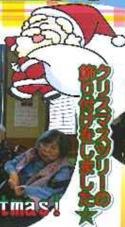
クリスマスを楽しみました