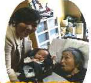
赤ちゃんを連れて遊びに 来てくれました♡