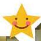
手熊では... 「もっとも~」